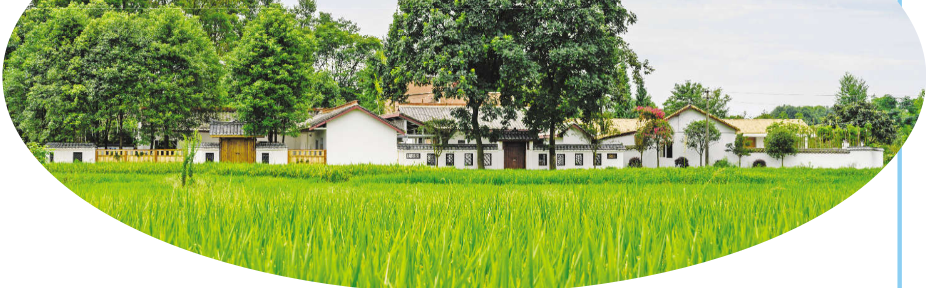
水梨村清流大书房林盘院落

隆冬时节，行进在成都市新都区清流镇翠云村，但见水清草绿，移步皆景，周末前来这里的游客络绎不绝。乡村旅游让这个村子实现了文旅融合，也成为了众多市民的“打卡地”，当地村民也端上了旅游这个“金饭碗”。