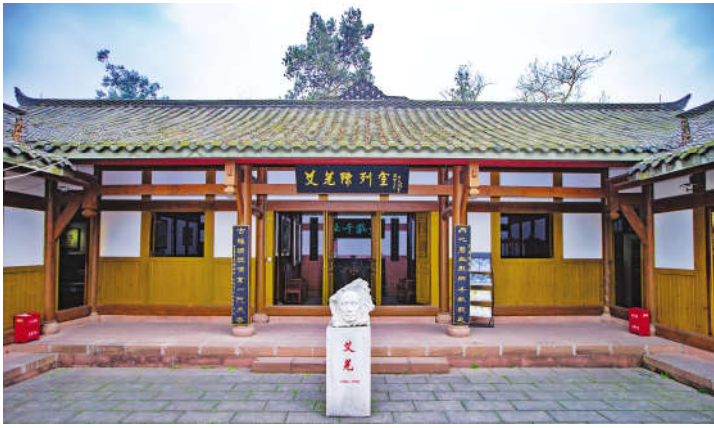
艾芜笔下的乡风民俗园