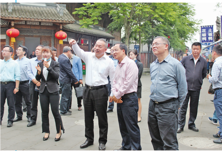
考察元通基层供销社

强组织、兴产业，最终都是为了惠民。元通供销社坚持为农服务宗旨，积极实施农产品投入品溯源体系建设。供销社所属“庄稼医院”是崇州市区域农资配送服务中心，农资服务覆盖元通镇及周边县市10多个乡镇，深受广大农民朋友的信赖。 在元通古镇，调研组了解到，元通供销社主动抓住古镇景区建设机遇，积极盘活资产，大力发展乡村旅游产业，新建改造“供销社饭店”“供销社农庄”“古镇客栈”等服务设施，2019年全年接待游客数十万人次，取得了很好的经济效益和社会服务效益，有效带动了经济持续健康快速发展，提升了当地居民的生活水平。