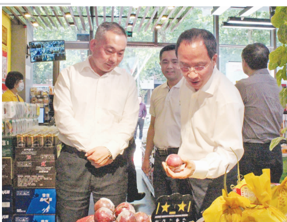
考察组参观老邻居城市生活超市银木佳苑店

琳琅满目的货品整齐堆码，果蔬摆放得整整齐齐，在灯光下显出诱人的色泽，肉蛋鱼的放置环境清洁无异味，工作人员忙碌着手上的活计……4月28日下午，调研组来到成都市锦江区银木街老邻居城市生活超市银木佳苑店，不时发出热烈的讨论声。 “现在肉价降了，疫情期间，肉价最高要38元一斤，去年最低达到18元一斤。” “皮厚的就是土猪肉，健康好吃，炒回锅肉最好。” “丑柑儿好便宜，才3块多，重庆要6元起步了，川渝离得近，有广阔的合作空间。” …… 据介绍，该超市主要经营工副食品、粮油米面、调味品、洗化用品、香烟、日用百货、生鲜蔬菜、肉类和水果，蔬菜和水果等生鲜商品销售占比高达40%，该店已完全实现“一站式”家庭采购便民服务功能。据了解，公司通过种植基地定向直采、与农业专业合作社通过订单式直供等模式，带动了近50个种植、养殖基地和近1000户农民实现增产增收。