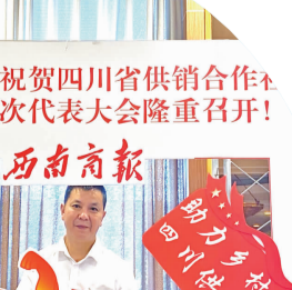
□本报记者 马工枚 文/图

“‘七代会’规格高、内容多。我社将以此次会议为契机，抓住机遇，主动作为，增强经营实力，为推进农业发展、助农增收出一份力！”曾才华说。