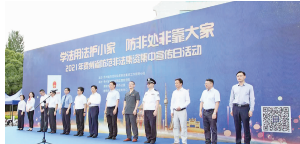
□本报记者 吴文俊 文/图

据悉，四川、重庆、贵州、云南、西藏五省(区、市)在医保异地直接结算方面有着深厚的合作基础。