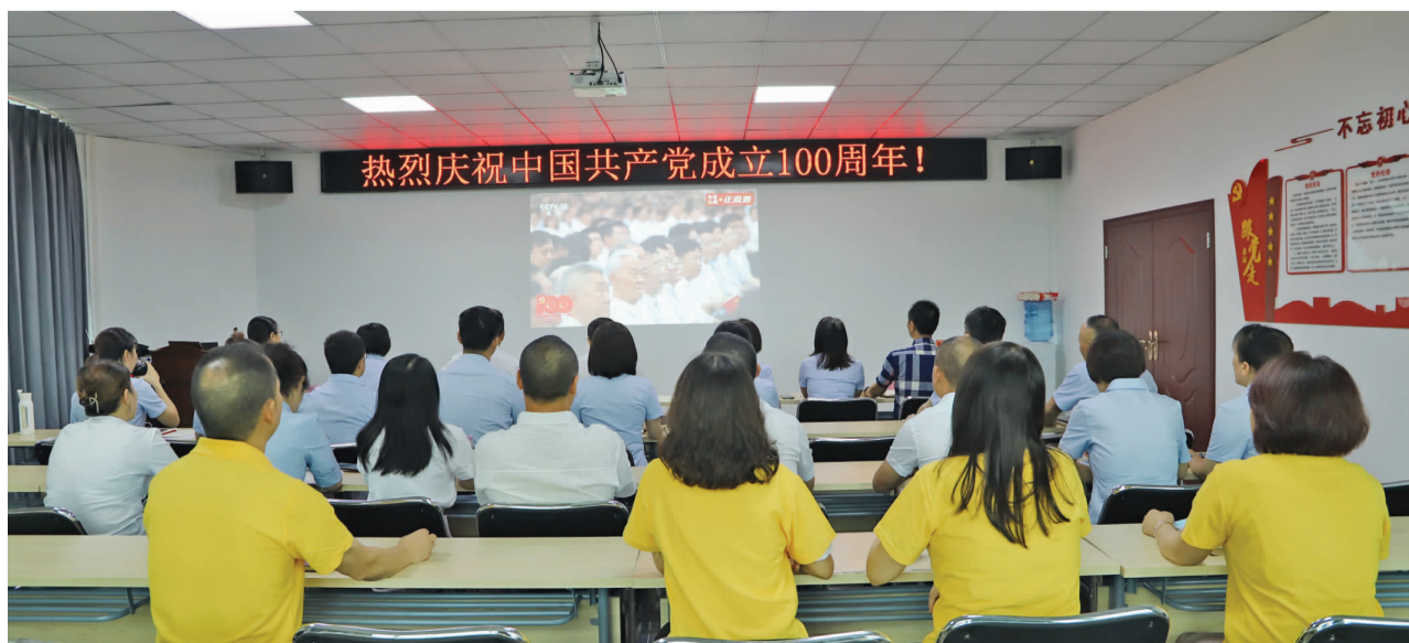
热烈庆祝中国共产党成立100周年!

四川省老邻居商贸连锁有限责任公司党支部组织干部职工收看庆祝中国共产党成立100周年大会盛况。