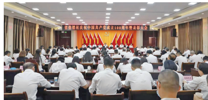
□本报记者 李艳/文