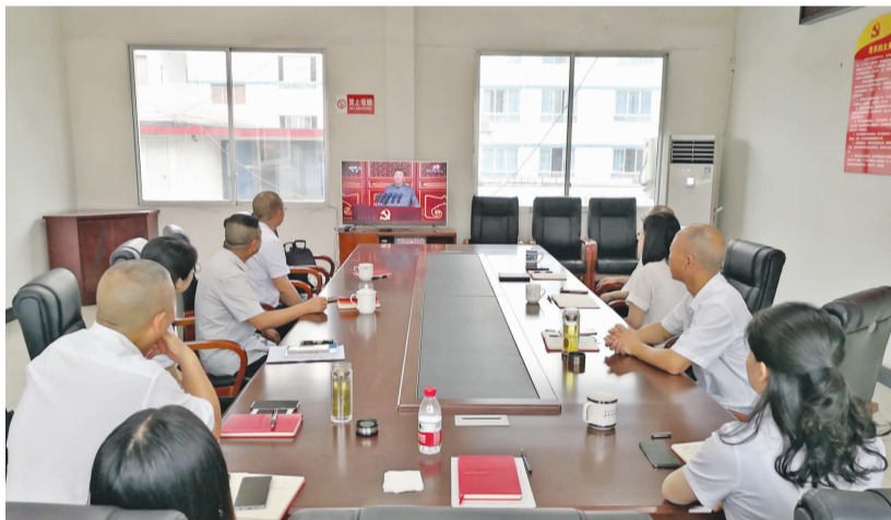
乐山市犍为县供销社干部职工集中收看庆祝中国共产党成立100周年大会盛况。