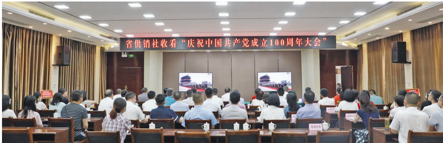
省供销社收看“庆祝中国共产党成立100周年大会”

7月1日上午8时,庆祝中国共产党成立100周年大会在北京天安门广场隆重举行,四川省供销社积极组织系统内干部职工集中收看大会直播,各地供销社在本单位准时收看,认真聆听了习近平总书记的重要讲话,共同回顾中国共产党百年奋斗的光辉历程,展望中华民族伟大复兴的光辉前景。