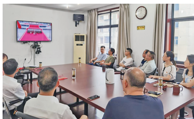
自贡市供销社组织干部职工收看庆祝中国共产党成立100周年大会盛况。