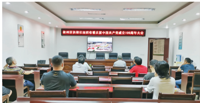
宜宾市叙州区供销社组织系统内干部职工收看庆祝中国共产党成立100周年大会盛况。