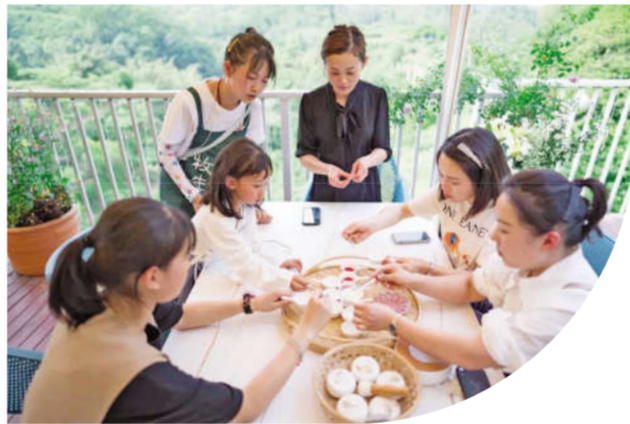
牧云谷林盘舒适的生活环境