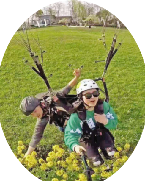
钱家大院林盘户外滑翔项目

下一步，该镇将结合新民村古村花海、大坪山朱院子、雾山河畔等土地资源，积极引入中传文旅、中交集团、西藏富丽集团、成都产投等企业，通过市场化模式参与鹤鸣镇乡村振兴和林盘保护修复，形成“春赏花、夏避暑、秋摘果、冬登山”等新业态。