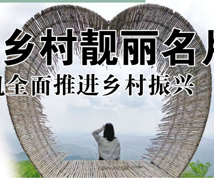
老贵顶林盘景观节点

盛夏时节，走进鹤鸣镇，一个个以林、水、宅、田为主要要素的川西林盘雏形初显，一望无际的田野上错落有致地点缀着一片片绿岛式的竹林，一座座别具特色的川西林盘藏身其间……形成了成都平原特有的川西田园风光。