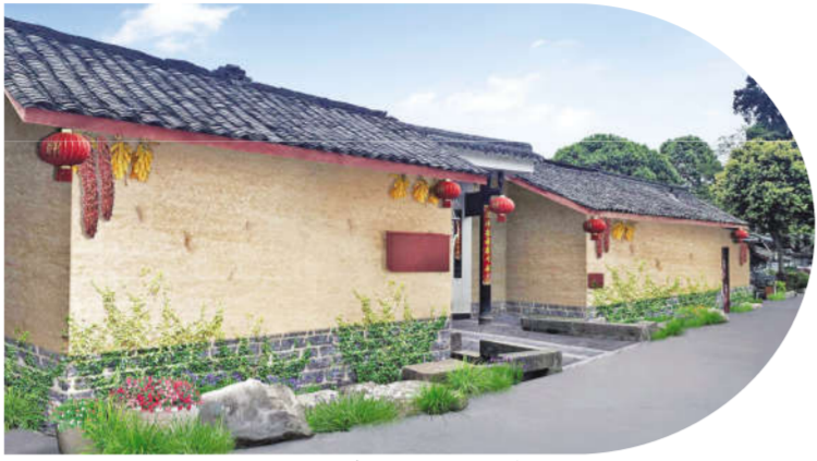
傅家大院川西林盘效果图