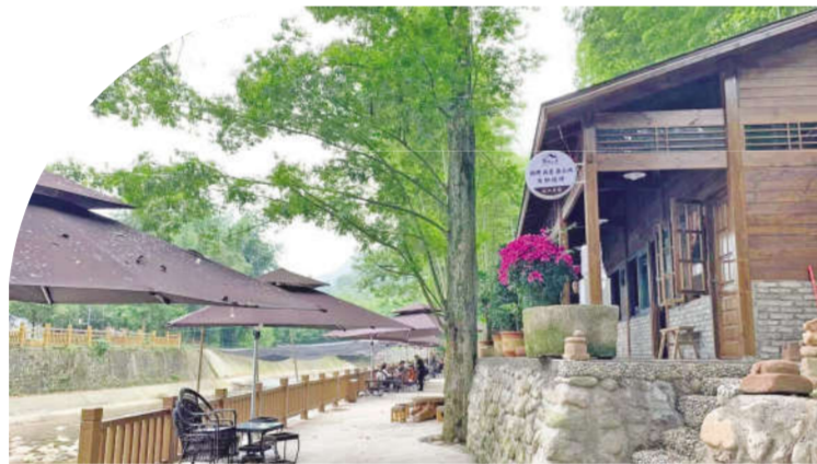
朱院子林盘大力发展旅游产业

以特色产业为核心，探索文化彰显、特色鲜明美丽乡村的新亮点。鹤鸣镇文化底蕴深厚，生态本底较好，区位优势明显，尤其是道禅文化在全国乃至全世界具有独特的文化IP，大坪山“金蜜李”作为国家地理标志产品独特而珍贵。为此，鹤鸣镇围绕道禅文化和特色产业积极打造禅修、文化体验、文创开发、山地运动、主题民宿等高品质产业林盘聚落，为乡村“五大振兴”奠定了坚实基础。