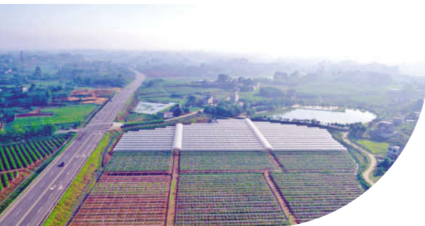
青白江区福洪镇上元桥社区农业基地