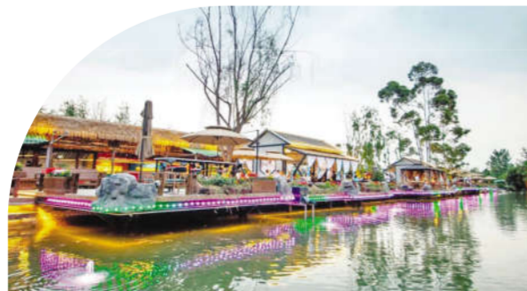
青白江区城厢镇蓉欧里川刷林盘火锅园

产业兴,乡村旺;产业振兴是乡村振兴的重中之重。青白江区乡村振兴中心始终抓住“产业协同”这个牛鼻子,立足特色资源,关注市场需求,在农业加工贸易、乡村文旅发展、林盘经济上做文章,促进“四片”与“一港双核”产业协同,推动乡村产业融合发展。