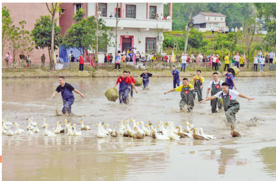
四川省广安市广安区石笋镇农民在稻田内举行捉鸭子趣味比赛