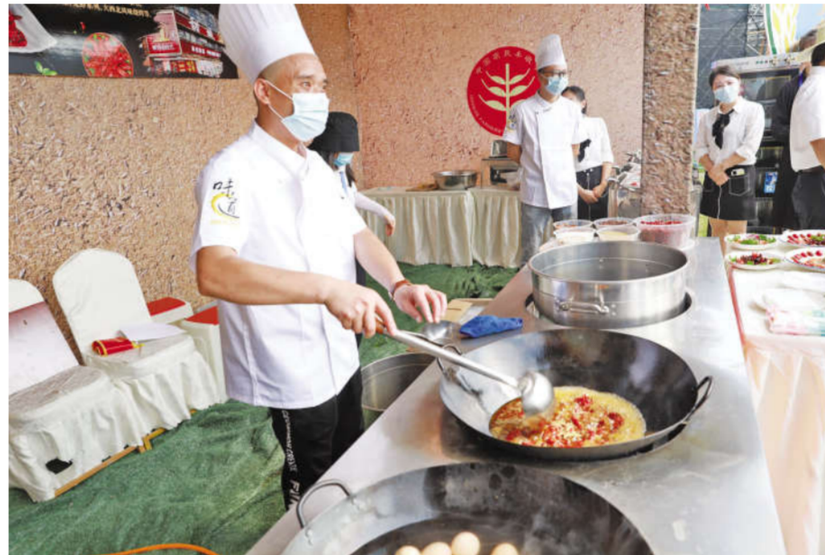
内江隆昌市农民丰收节小龙虾烹饪现场