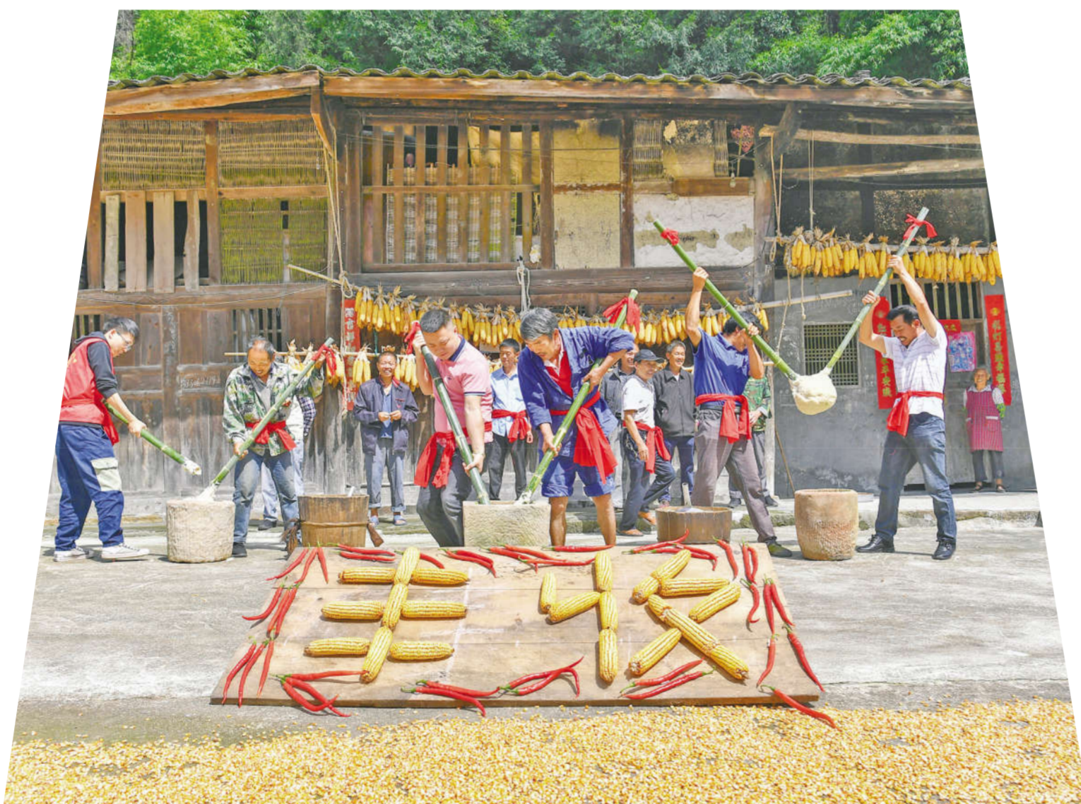
四川邻水县观音桥镇汤巴丘村的村民们通过抢收水稻、稻田摸鱼、打糍粑等民俗、农事活动,齐颂祖国、共庆丰年。