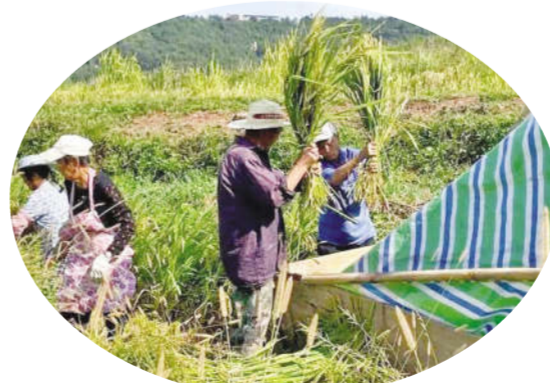
四川通江广纳镇顺石岭举行“庆丰收 尝新米 助振兴”农民丰收节庆祝活动,图为打谷子现场。