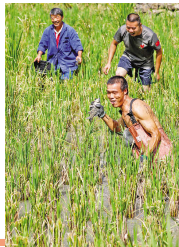
四川通江广纳镇顺石岭举行“庆丰收 尝新米 助振兴”农民丰收节庆祝活动,图为抓鱼现场。