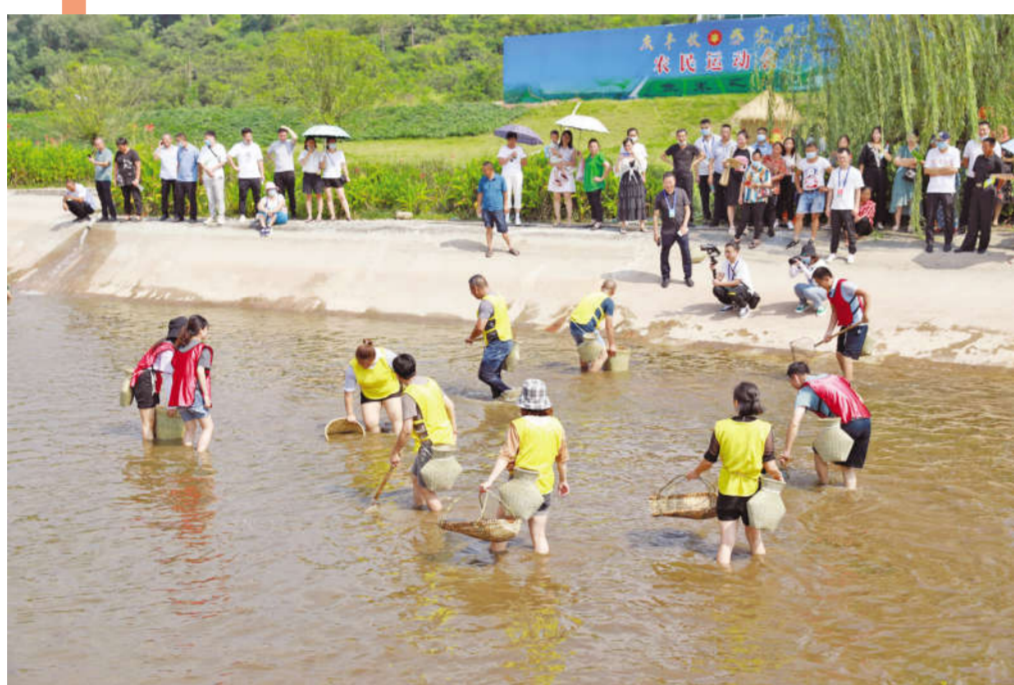
内江隆昌市农民丰收节捕鱼活动现场